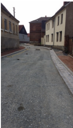
Grundhafter Ausbau der Straße Im Unterdorf