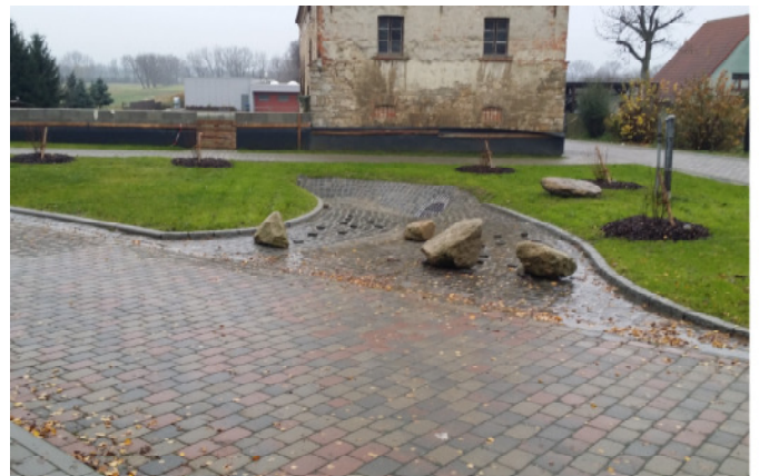
Gestaltung Regenrückhaltebecken in Natursteingroßpflaster